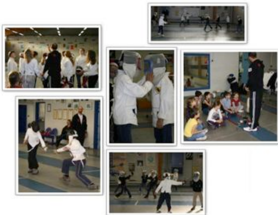
Avec en prime quelques coups d'épées