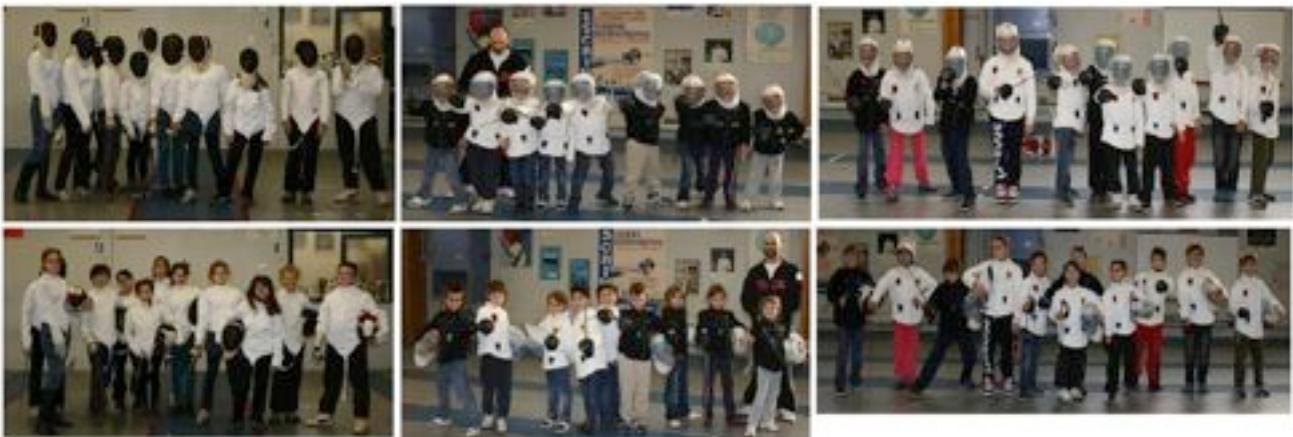
De quoi débiter l'année en beauté !!!!