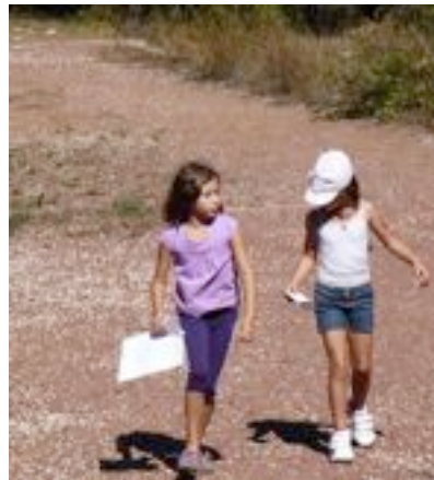
Jeu de piste